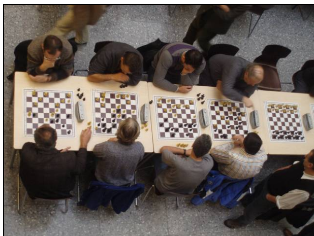
die LM-Turnieratmosphäre aus der Vogelperspektive