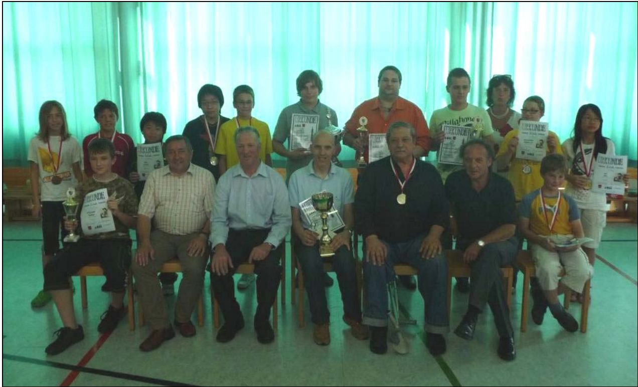
Hier ein Foto mit allen Siegern der diesjährigen Braunauer Stadt- und Bezirksmeisterschaften