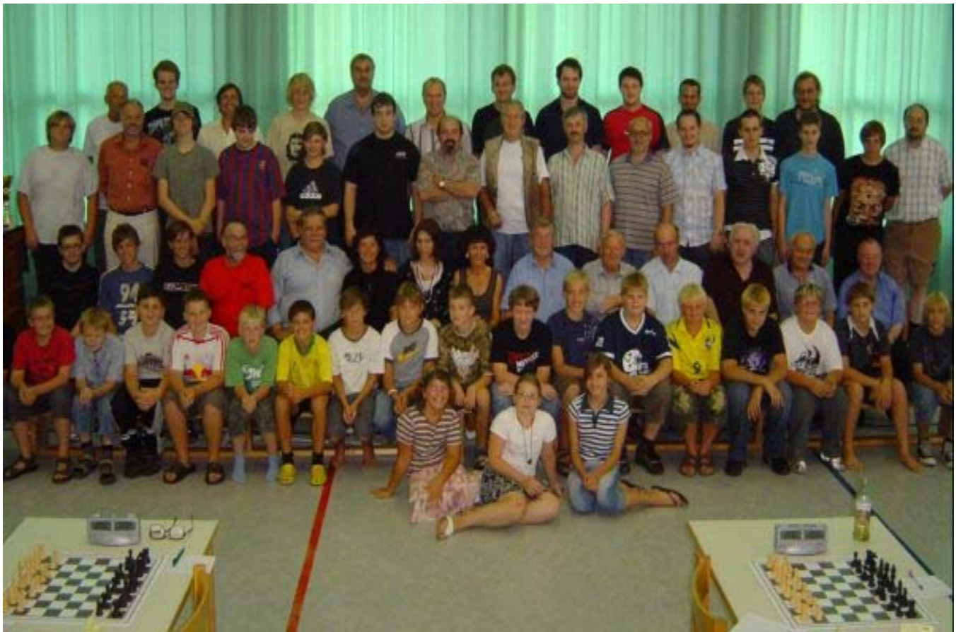
Braunauer Stadt- und Bezirksmeisterschaft 2008 Jugendturnier