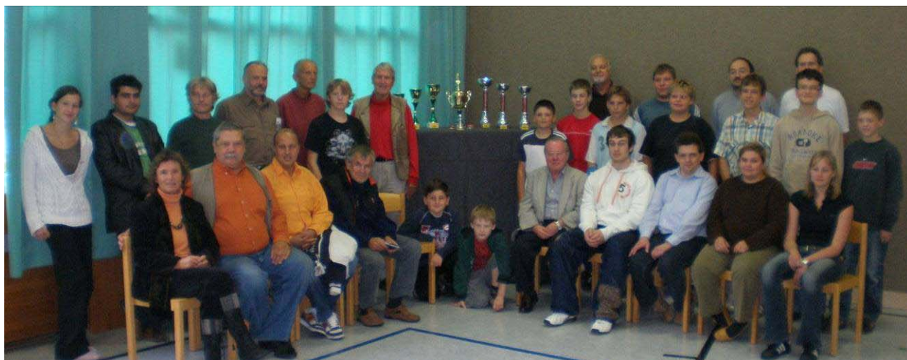
Das Teilnehmerfeld der diesjährigen Braunauer Bezirksmeisterschaft